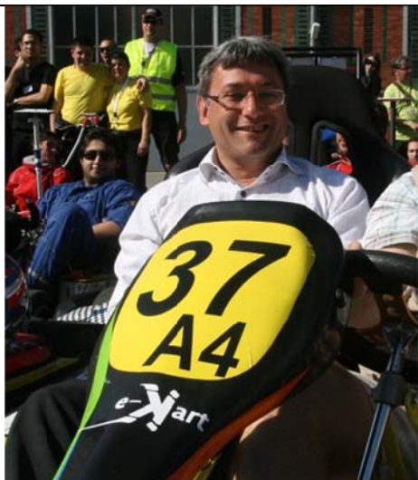
Sur le nasseau panel

Le kart devra porter son numéro de façon lisible sur le nasseau panel à l'avant, sur les 2 cotés et à l'arrière. Le numéro du kart est le numéro de l'équipe, 37H par exemple, s'il n'y a qu'un seul kart. Il est suivi d'un numéro s'il y a plusieurs karts dans l'équipe : 37H1 et 37H2.