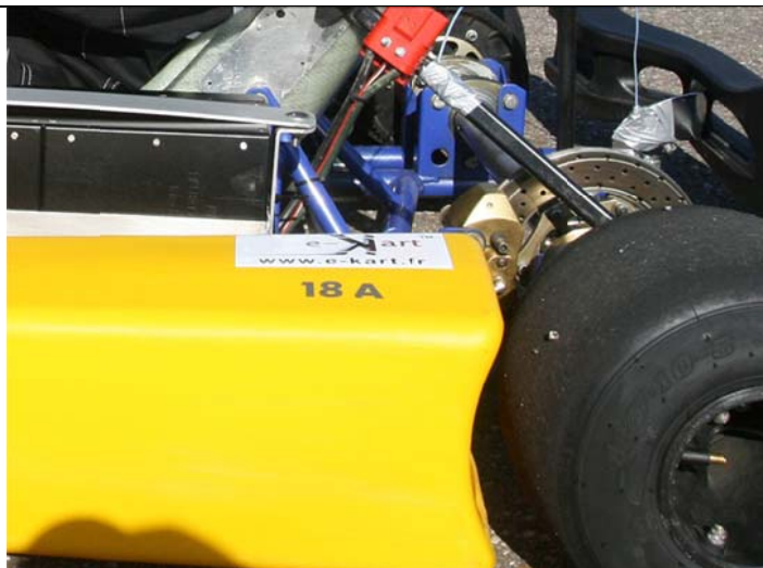
Sur les pontons