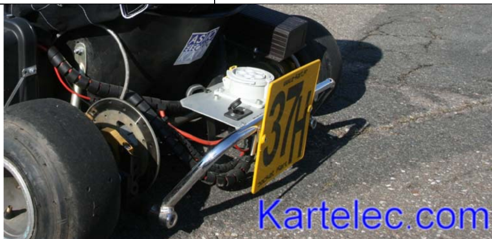
Sur le panneau à l'arrière du kart