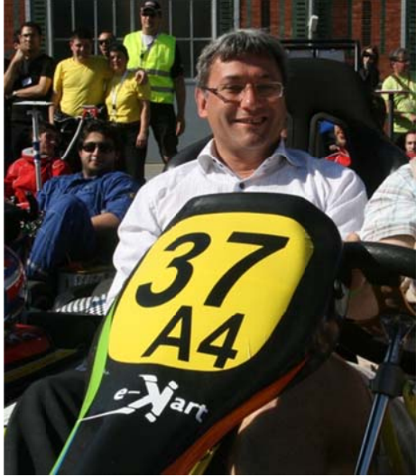
Sur le nasseau panel

Le kart devra porter son numéro de façon lisible sur le nasseau panel à l'avant, sur les 2 cotés et à l'arrière. Le numéro du kart est le numéro de l'équipe, 37H par exemple, s'il n'y a qu'un seul kart. Il est suivi d'un numéro s'il y a plusieurs karts dans l'équipe : 37H1 et 37H2.