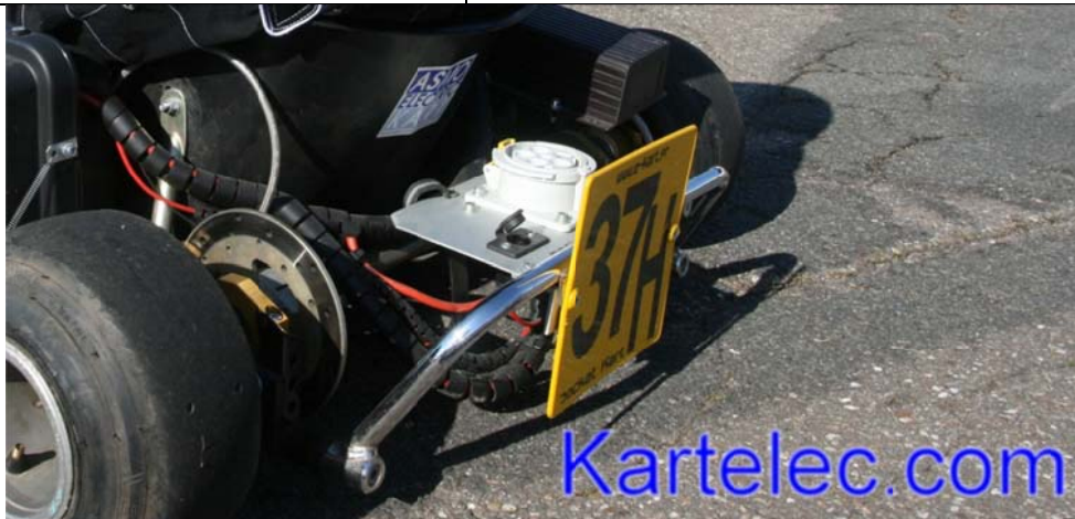
Sur le panneau à l'arrière du kart