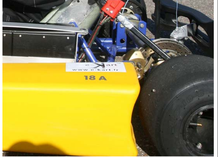
Sur les pontons